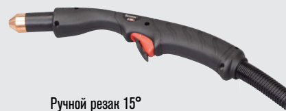
Ручной резак 15°