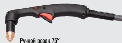
Ручной резак 75°

(дополнительные варианты резаков см. на веб-сайте www.hypertherm.com )