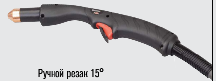
Ручной резак 15°