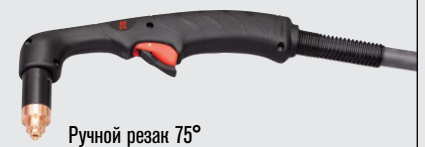
Ручной резак 75°

(дополнительные варианты резаков см. на веб-сайте www.hypertherm.com )